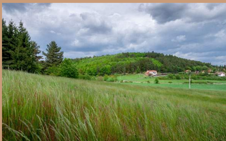
↑ Vrch Nečinská Besídka s osadou Žebrák ➤ Rozcestník turistických značek u osady Žebrák

mu i okolí intenzivní těžba, postupem času však místo zpustlo, pamětníků ubylo, lokalitu opět pohltila příroda. V letech 2010–11 byla lokalita obcí Nečín, místními občany, školními dětmi a přizvanými muzejními pracovníky a architektky upravena v duchu jejího odkazu. Místo na západním okraji vrchu Besídka bylo vyčištěno od odpadků, objevily se zde dubové lavičky a kamenný stůl. Zbudovány byly nové kamenné schůdky a do středu celého prostoru dán balvan s vytesaným úryvkem z knihy Eduarda Štorcha Bronzový poklad . Místo je opravdu