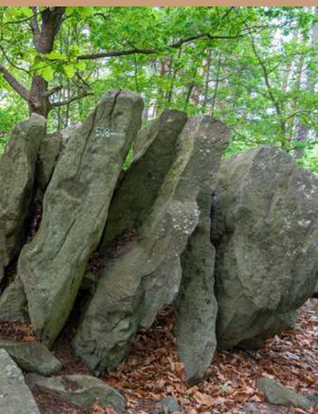
↑ Vrchol Nečinské Besídky zdobí krásné, rozeklané žulové skalisko.