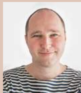
↑ Text a foto: Vojtěch Pavelčík

→ Kamenolom žiraska je používán i jako horolezecká stěna.